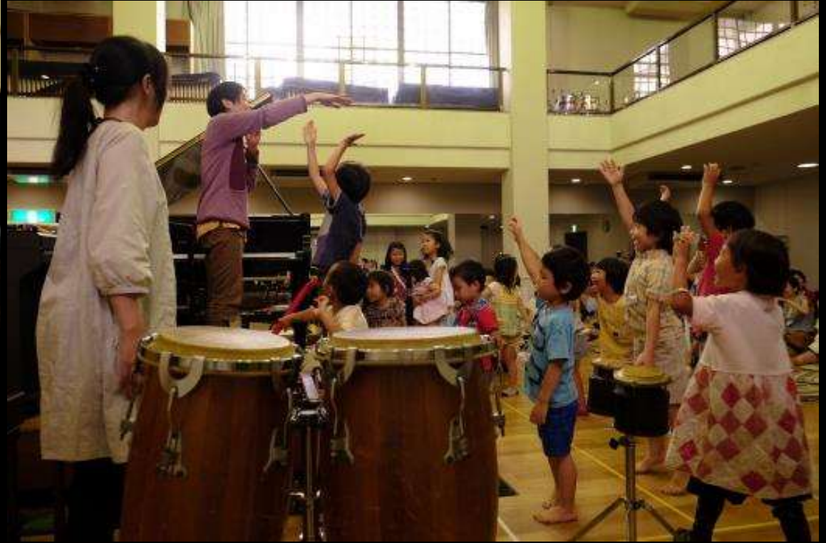
キッズ・ミート・アート2015 「ノムさんのスッポコペー音楽会～まじる、ずれる、かさなる音～」 野村誠(作曲家・ピアニスト)